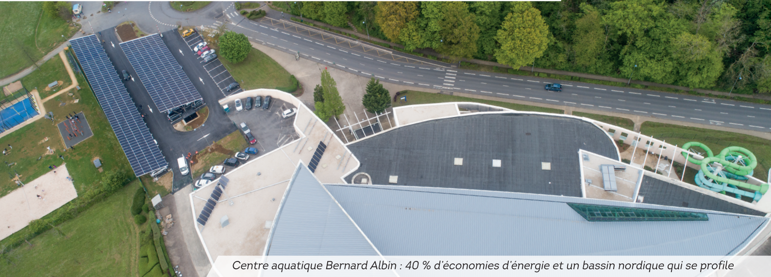
Centre aquatique Bernard Albin : 40 % d'économies d'énergie et un bassin nordique qui se profile

Aiglemont Arreux Les Ayvelles Balan Bazeilles Belval Chalandry-Élaire La Chapelle Charleville-Mézières Cheveuges Cliron Daigny Damouzy Dom-le-Mesnil Donchery Étrépigny Fagnon Fleigneux Flize Floing Francheval La Francheville Gernelle Gespunsart Givonne Glaire La Grandville Hannogne-Saint-Martin Haudrecy Houldizy Illy Issancourt-et-Rumel Lumes Montcy-Notre-Dame Neufmanil Nouvion-sur-Meuse Nouzonville Noyers-Pont-Maugis Pouru-aux-Bois Pouru-Saint-Rémy Prix-lès-Mézières Saint-Aignan Saint-Laurent Saint-Menges Sapogne-et-Feuchères Sécheval Sedan Thelonne Tournes Villers-Semeuse Villers-sur-Bar Ville-sur-Lumes Vivier-au-Court Vrigne-aux-Bois Vrigne-Meuse Wadelincourt Warcq