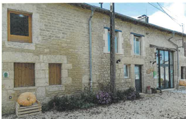
Rénovation d'une façade ancienne à BULSON .