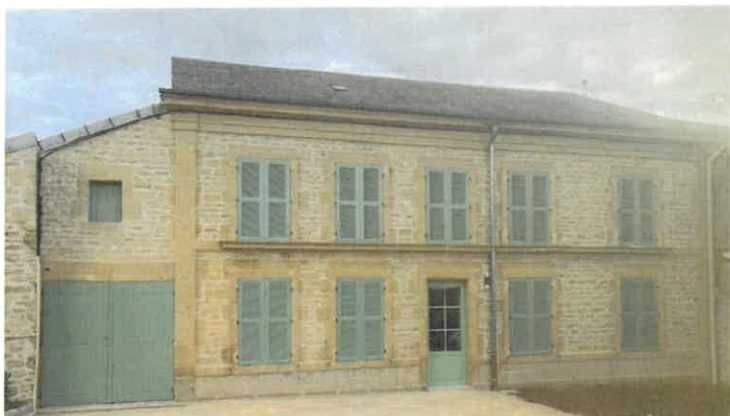
Rénovation de la façade de l'ancien presbytère de CHEVEUGES avec la création de deux logements locatifs.