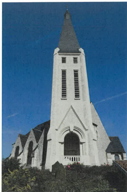
Rénovation de la façade de l'église de MANRE .