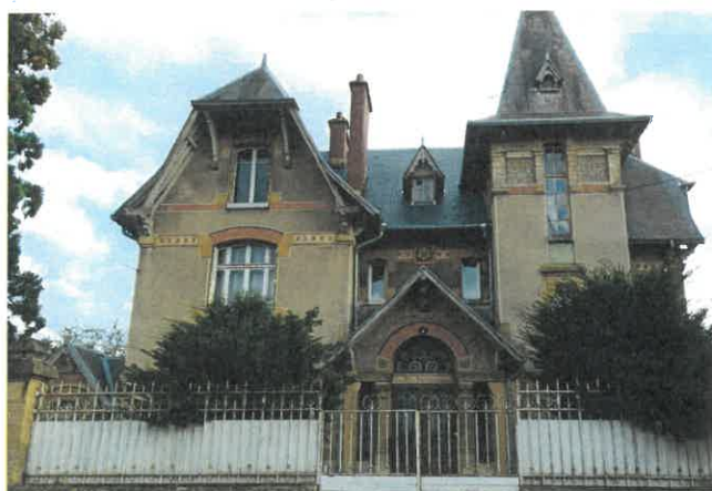
Travaux sur une maison à SEDAN avec le label de la Fondation du Patrimoine

Contact : Fondation du Patrimoine Délégation Champagne Ardenne Bernard de Lauriston fixe 03 26 97 81 72 - Mobile 07 88 49 65 70 bernard.delauriston@fondation-patrimoine.org