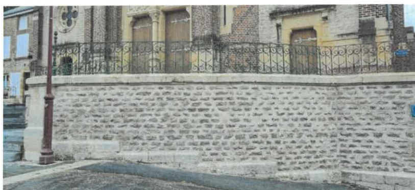
Rénovation d'un muret au centre de BALAN .

Ensemble, continuons à embellir nos communes et à accroître l'attractivité des Ardennes !